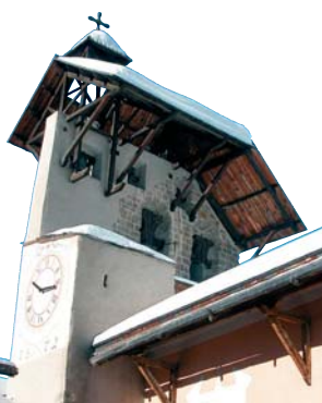
Le village de Ceillac en hiver.

Plein sud, cet itinéraire offre une vue panoramique sur le village et la chaîne de la Font Sancte (3385 m), point culminant du Parc naturel régional du Queyras. C'est l'endroit idéal pour bien observer l'implantation des différents groupes de maisons sur la plaine de Ceillac, ancien lac glaciaire comblé par les alluvions des torrents du Mélezet et du Cristillan.